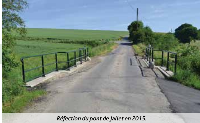
Réfection du pont de Jallet en 2015.

→ PATRIMOINE - LOCATION DE CHASSES COMMUNALES SITUÉES AU LOT 1 (BOIS D'OHEY ET HALTINNE) - ARRÊT DU CAHIER DES CHARGES - CHOIX DU MODE DE REMISE DE LOCATION - DÉCISION