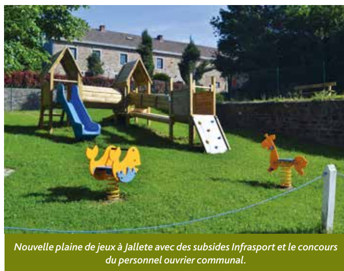
Nouvelle plaine de jeux à Jallette avec des subsides Infrasport et le concours du personnel ouvrier communal.