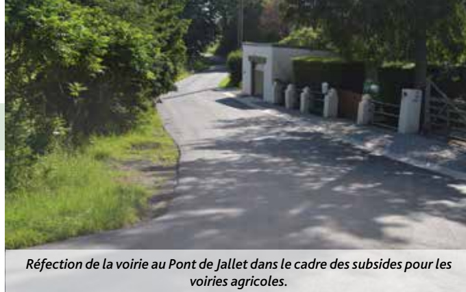
Réfection de la voirie au Pont de Jallet dans le cadre des subsides pour les voiries agricoles.