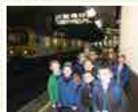
Bruxelles Luxembourg est une grande gare!