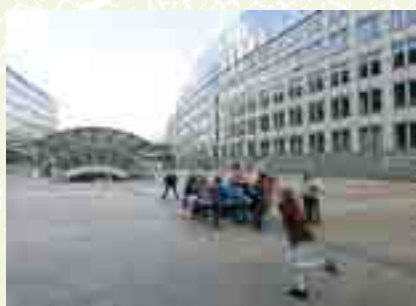
On se défoule avant le train du retour.