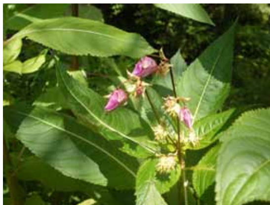
Balsamine de l'Himalaya en début de floraison. La couleur des fleurs peut varier du blanc au pourpre. La tige et les nervures des feuilles ont souvent une coloration rougeâtre.