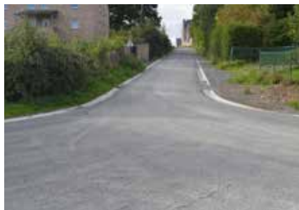
Rue Sur les Sarts à Perwez

Perwez et l'autre au Pont de Jallet pour la somme de 67.000€ TVAC. Voici un petit montage photographique pour vous donner une idée des travaux réalisés.