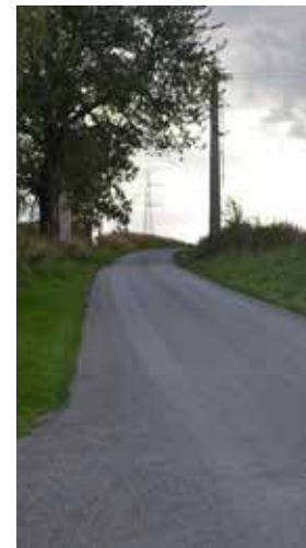
Rue de la Béole à Evelette