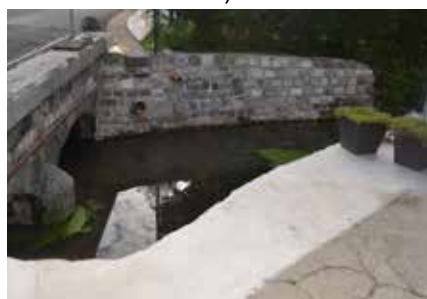
Pont sur le Lilot