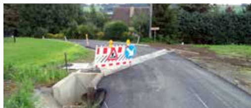
Aménagement de voirie à Baya