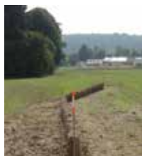
Fascine de paille à Libois