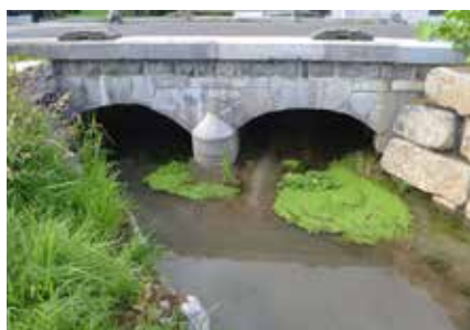
Pont sur le Lilot