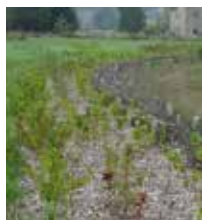
Fascine de branchage et haie triple rangs à Libois