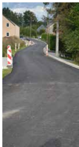
Baya (réfection de la voirie mais aussi lutte contre les inondations)