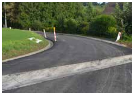
Baya (réfection de la voirie mais aussi lutte contre les inondations)