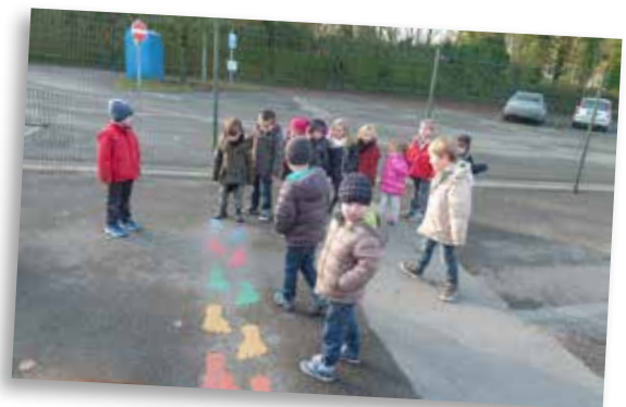
et nous ... les petits « Pas Malinofs » On apprend ensemble à se ranger

Nous avons décidé de rester toute notre vie auprès de nos petits amis de maternelles à l'Ecole Communale d'Ohey. C'est grâce au Comité Saint-Christophe d'Ohey que nous sommes là.