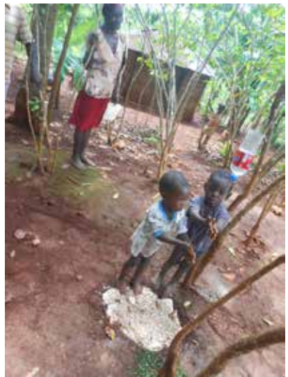
Apprentissage du lavage des mains à la sortie des latrines

Plus d'infos sur les projets Pro Action Développement : www.proactiondev.org