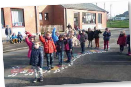
Je suis la chenille « Calculof » On apprend ensemble à compter

Nous sommes placées dans la cour de récréation maternelle à l'Ecole Communale d'OHEY depuis cette rentrée scolaire 2015-2016.