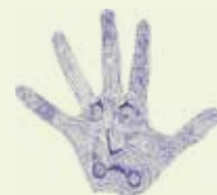
L'équipe du Gros d'Ohey

Le formulaire d'inscription et un document reprenant les conditions de participation sont disponibles sur le site : www.legrosdohey.be