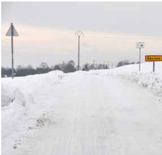
Rue de Brionsart/Rue de Reppe, côté Gesves