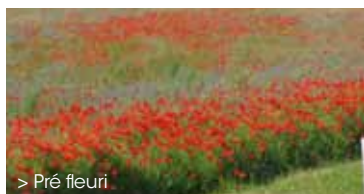
> Pré fleuri