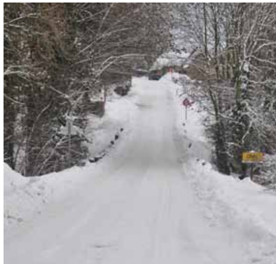
Rue de Brionsart/Rue de Reppe, côté Ohey

vent en outre assurer le déneigement dans la demi-heure de l'appel de la Commune. Ce système fonctionne relativement bien et le marché est relancé chaque année, permettant une évaluation régulière.