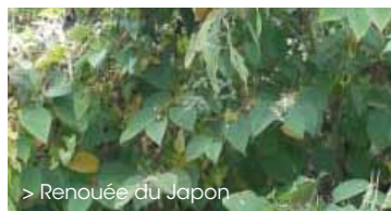
> Renouée du Japon