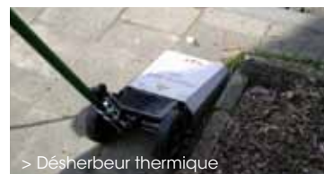
> Désherbeur thermique