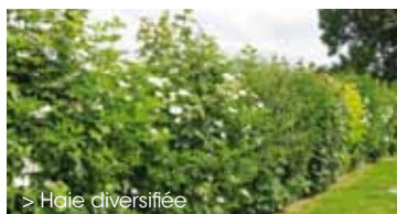
> Haie diversifiée