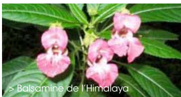
> Balsamine de l'Himalaya