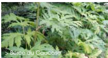
> Berce du Caucase