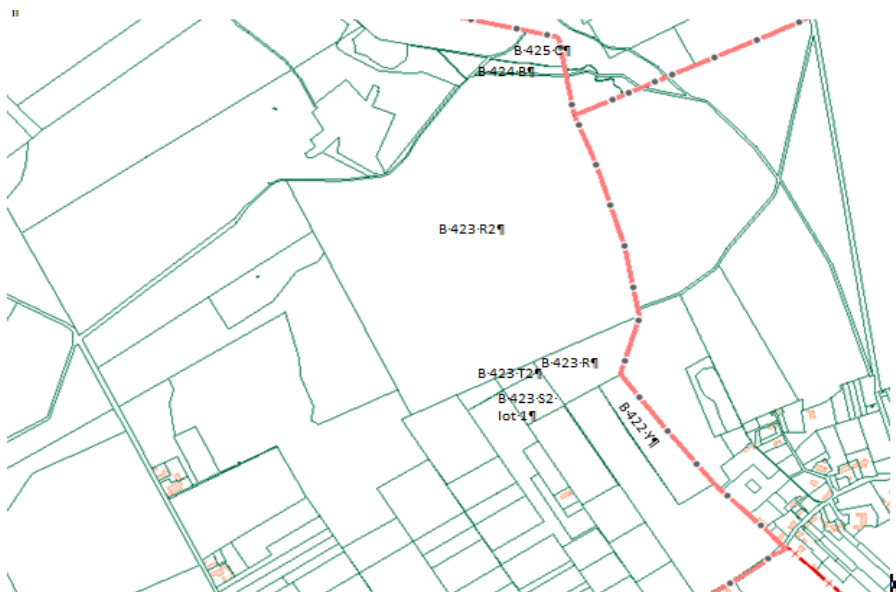
Figure 1 : Bois d'Haltinne