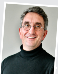
Pour le Collège, Christophe Gilon Bourgmestre en charge de l'enseignement